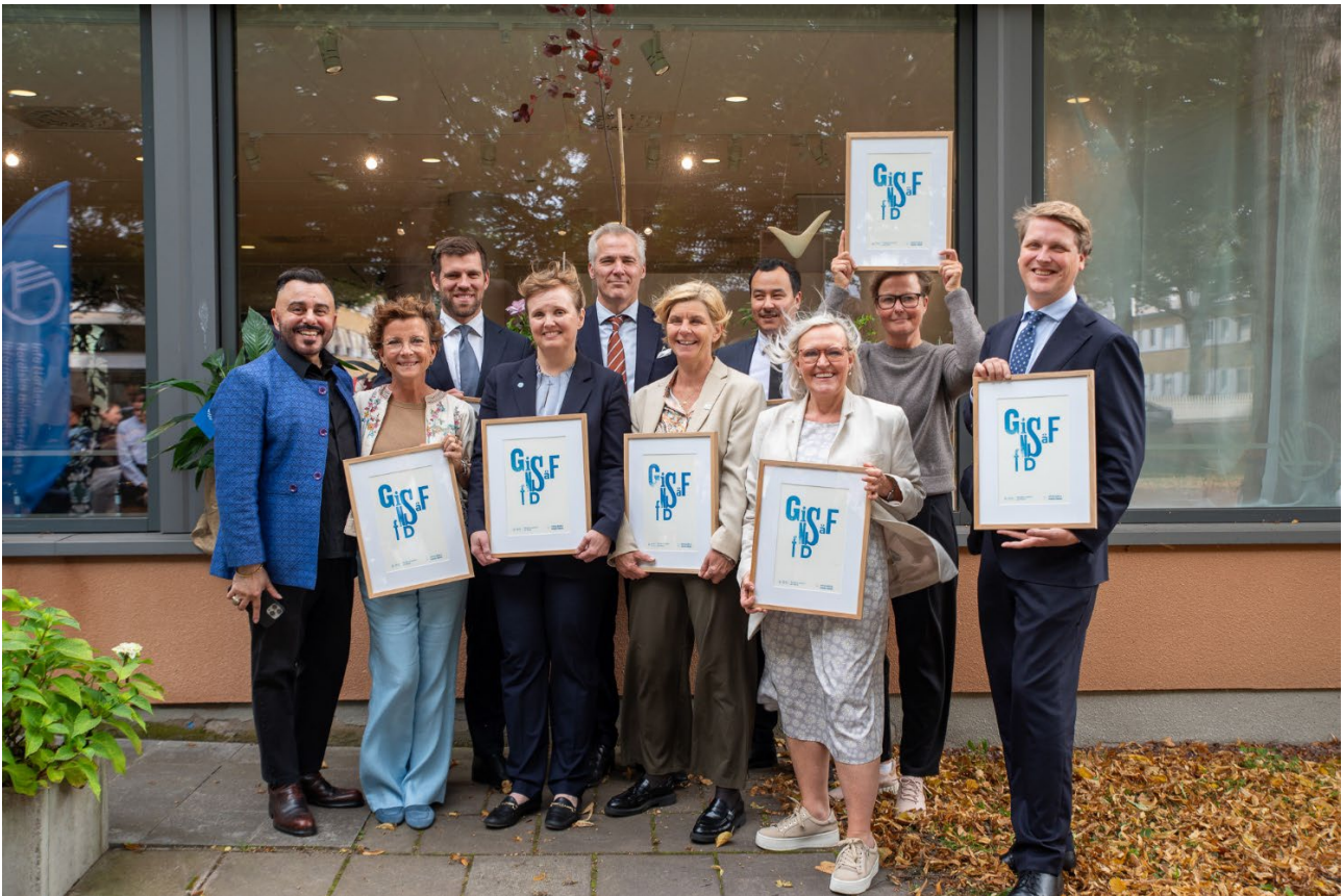
(Nordens institut firade 40 år den 11 september. Här med representanter från de nordiska regeringarna, Nordiska ministerrådets generalsekreterare och institutets direktör.)

Nordens institut på Åland – NIPÅ - är en kulturinstitution under Nordiska ministerrådet med uppdrag att stödja, stimulera och utveckla kulturlivet genom att: